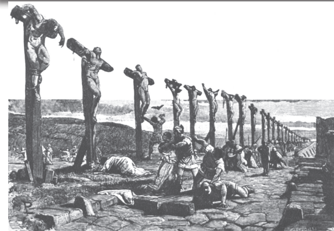
73-71 a. C.