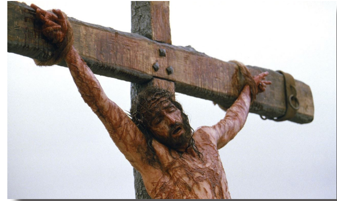
Gesù di Nazareth (0-33)