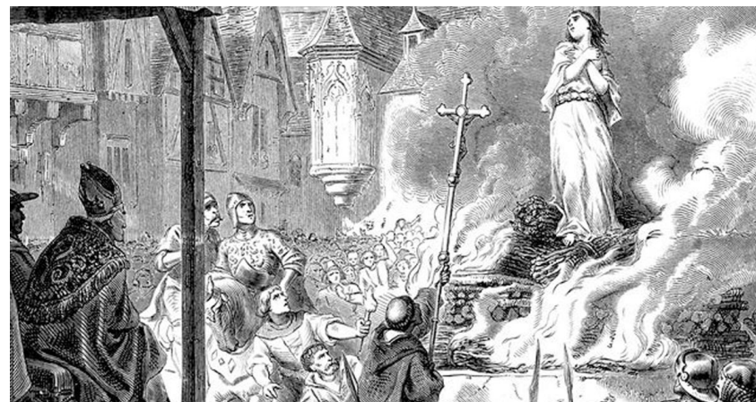
Immagine emblematica degli innumerevoli roghi che causarono decine di migliaia di vittime per opera della Santa Inquisizione della Chiesa Cattolica dal 1184 al 1821.