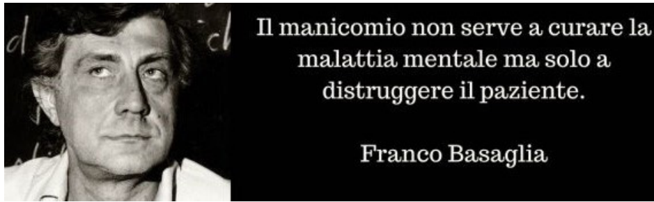
Franco Basaglia (Venezia 1924-1980)