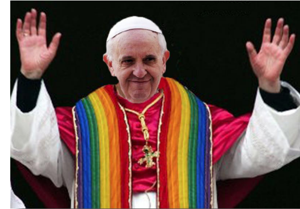
Papa Francesco (Giorgio Bergoglio, Argentina 1936) è stato eletto Pontefice dalla Chiesa Cattolica il 13 marzo 2013. Mostra di essere un “Papa sobillatore” perché vuole una Chiesa Ospedale da Campo. Ci riuscirà?