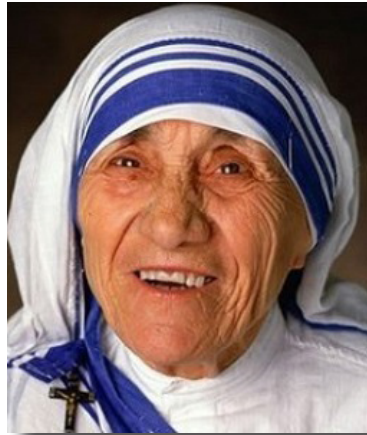
Il Mahatma Gandhi (1869-1948) e Madre Teresa di Calcutta (1910-1997)